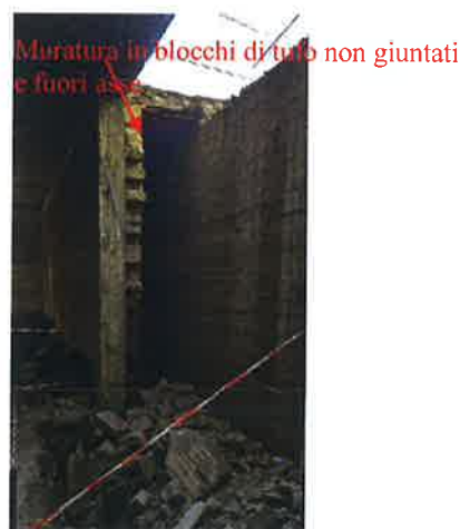
- Opere di demolizione -